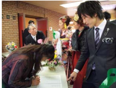
受付を済ませて会場へ