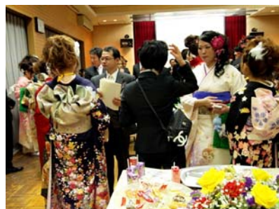
恩師との佐鳴台小中学校時代の思い出話で盛り上がる（交流会）