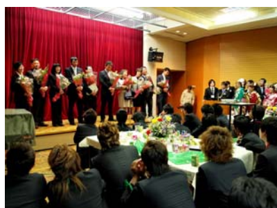
恩師の話を前列は蹲んで拝聴