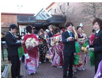
式典後のひととき