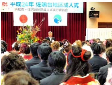
中条委員長の挨拶