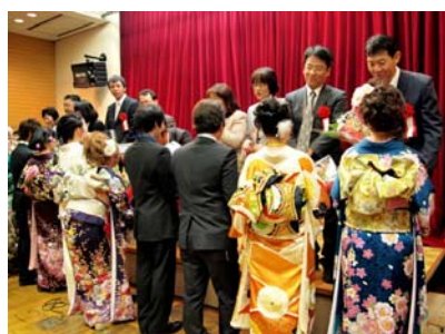
恩師への花束贈呈