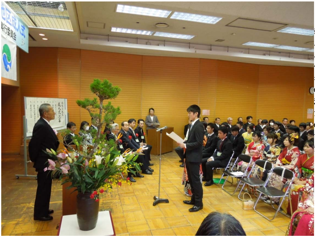
新成人代表の決意の言葉