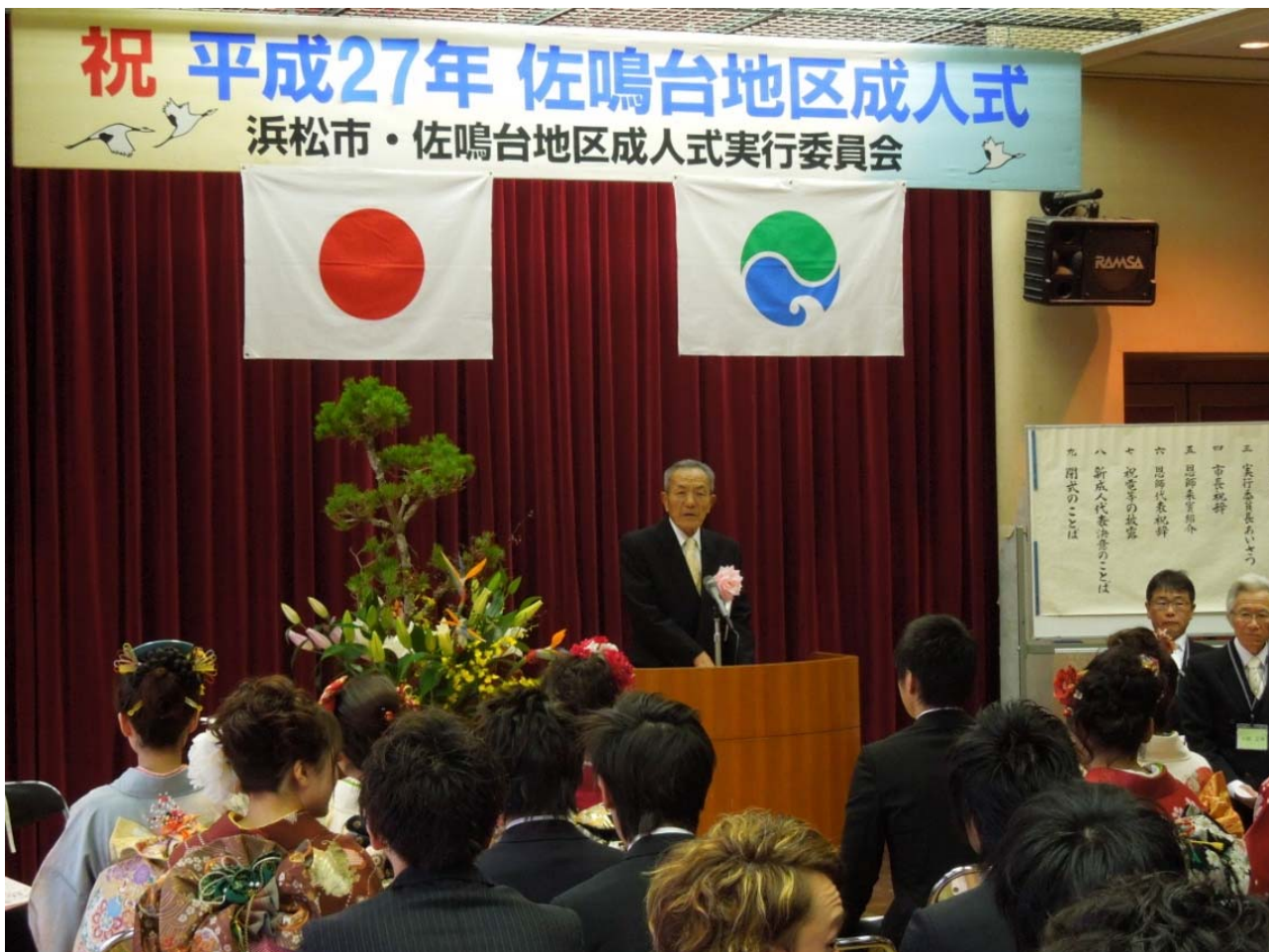
実行委員長あいさつ